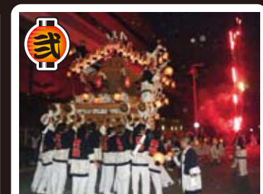
魚崎宮入 4日は、親地車での本山パレード参加。5日には、子ども神輿、子地車、親地車3台での町内巡行、夜の宮入も見どころです。