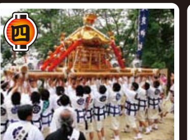
保久良みこ 今年の昇番地区は、北畑地区です。5月5日、保久良神社より鷺宮八幡神社へ御神輿渡御。是非、ご覧下さい。