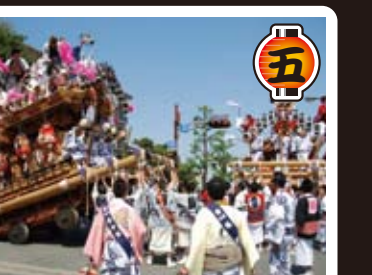
新反高橋 5月5日(日)14時頃、住吉神社庄内地区岡本、野寄、横屋、西青木の4台が顔を合わせ、宮入へむかいます。