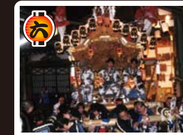
森宮入 森地車の運行では福荷参道で深江地車と青木地車が合流して練りまわしなどで賑い、観客も多く活気ある賑わいを見せます。(5月3日・金)又、すぐ北の赤島居下を地車が行く光景は一幅の絵のようです。是非、ご覧下さい。