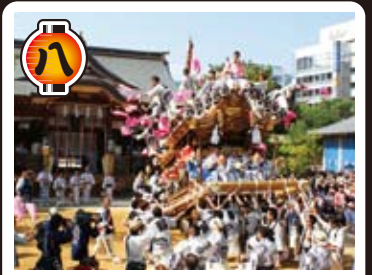
本住吉神社庄内地区宮入 5月5日午後3時頃より本住吉神社に於いて庄内氏子として宮入を奉納します。豪華絢爛な地車が揃います。