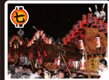
鷺の宮宮入 5月5日に保久良神社からの御神輿渡御をお迎えするため、4日の宵宮午後8時30分より、北畑・田邊・小路・中野の4地区の地車が保久良神社御旅所に集結し、勇壮且つ華麗な宮入を行います。