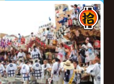
パレード 神戸市の住吉川以東地区から10地区の「だんじり」が参加します。毎年このゴールデンウィークには神戸市の各地では「だんじりまつり」が開催されます。その中で最も盛り上がる催しがこの「本山だんじりパレード」です。10地区の「だんじり」が間近に見られて、勇壮で、優雅な「だんじり」のやりまわしが魅力的です。是非、皆様も神戸一の「だんじりパレード」をどうぞお楽しみ下さい。