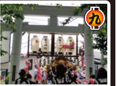
春日神社宮入 今年も地区の子供たちと一緒に本山パレードに参加します。また5日の本住吉神社宮入、町内での夜の練りは実に勇壮です。ご期待ください。