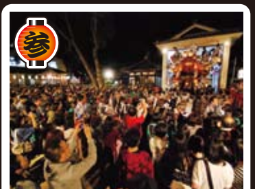
大日女尊神社宮入 5月5日午後9時30分頃より宮入を行い最後の庫屋入れでの熱気溢れるパフォーマンスをお楽しみ下さい。